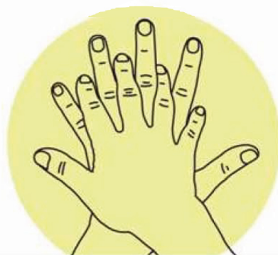
2 Paume sur dos Désinfection des doigts et des espaces interdigitaux