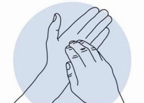
6 Ongles Désinfection des ongles