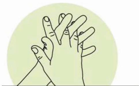
3 Doigts entrelacés Désinfection des espaces interdigitaux et des doigts